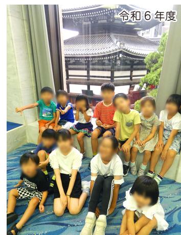
「LEAP Summer Program」にて生け花体験

Kirara LEAP では夏休みに引き続き、冬休み期間中に、特別プログラムとして下記の要領で LEAP Winter Program を企画いたしました。このウィンタープログラムは LEAP 受講生だけでなく、初めての方・一般の方もご参加いただけます。冬休み期間中は下記のプログラムだけでなく、LEAP の通常クラス—Language Development (英語クラス) と Fun Activity (アクティビティ) もいたします。長い一日を楽しく元気に過ごすため、きらら学園4Fの体育館に移動して、身体を動かすゲームもいたします。皆様お誘いあわせのうえ、奮ってご参加ください。