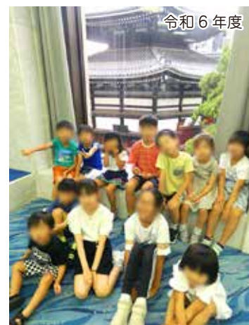
「LEAP Summer Program」にて生け花体験

Kirara LEAP では夏休みに引き続き、冬休み期間中に、特別プログラムとして下記の要領で LEAP Winter Program を企画いたしました。このウィンタープログラムは LEAP 受講生だけでなく、初めての方・一般の方もご参加いただけます。冬休み期間中は下記のプログラムだけでなく、LEAP の通常クラス—Language Development (英語クラス) と Fun Activity (アクティビティ) もいたします。長い一日を楽しく元気に過ごすため、きらら学園4Fの体育館に移動して、身体を動かすゲームもいたします。皆様お誘いあわせのうえ、奮ってご参加ください。